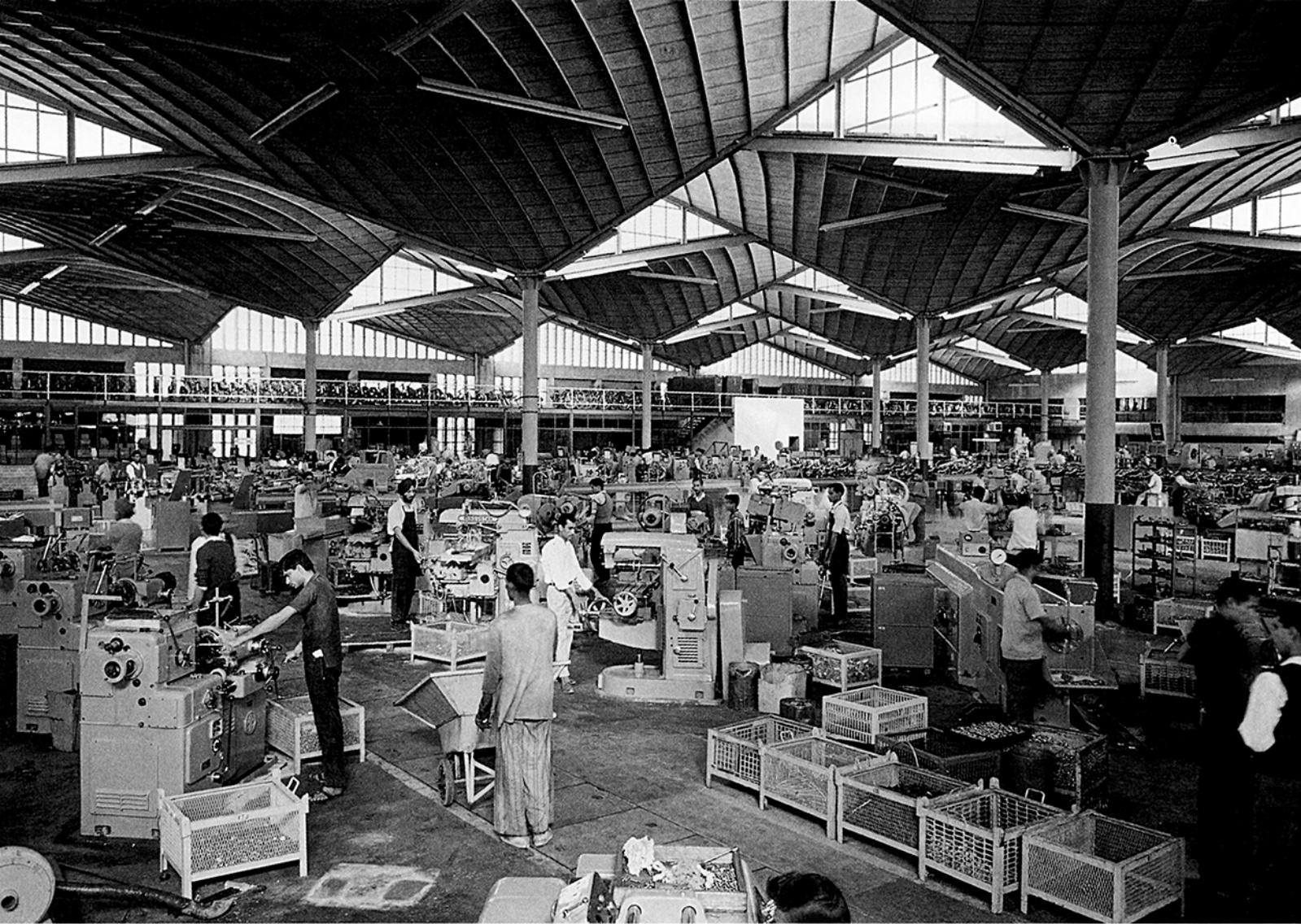
^ Intérieur de l'usine Escorts, 1964. Architecte Joseph Allen Stein. V Gujarat Bhawan, 1969. Architecte A. P. Kanvinde.