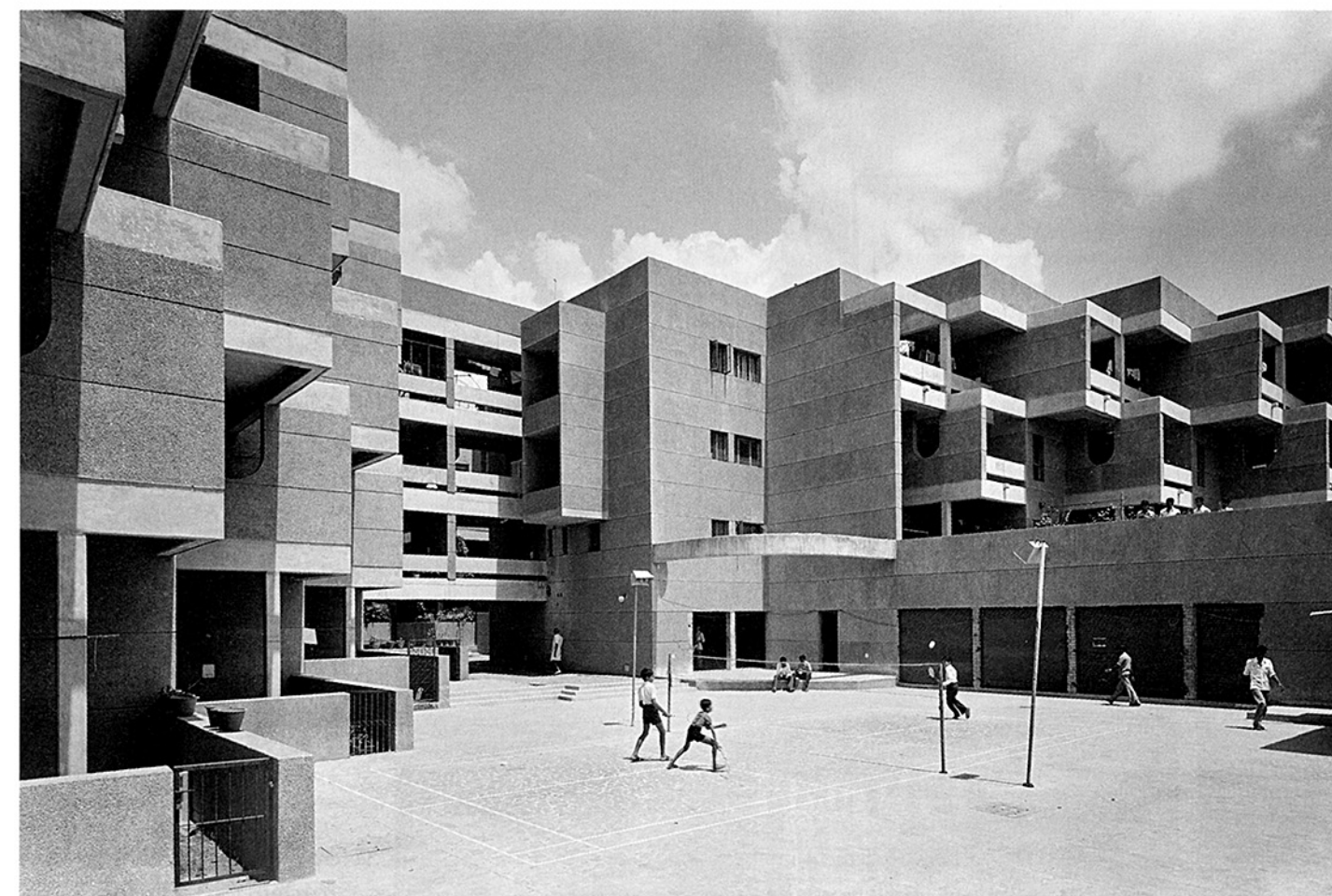
^ Yamuna Appartments, 1981. Architectes The Design Group. V British Council, 1995. Architecte Charles Correa.